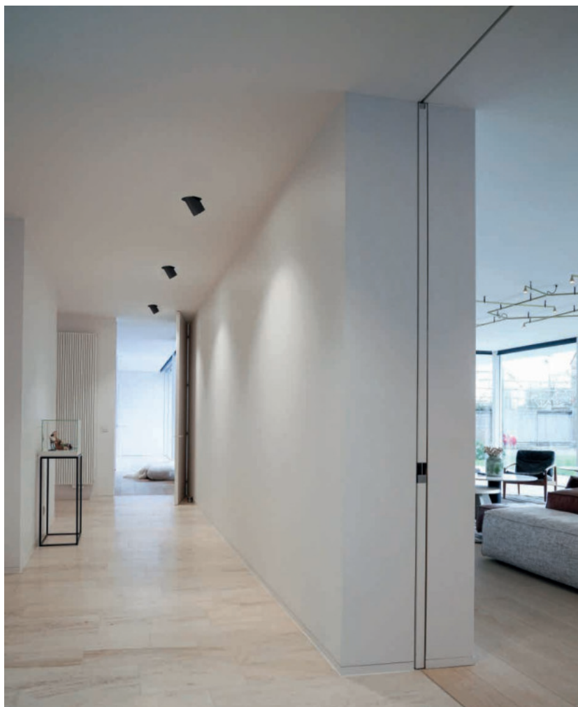
◀ Anwendungsbild: NOKTA

ZLED-625NOK10 · \frac{1}{1} · \frac{92}{2} · \frac{08}{3} · \frac{2}{4} · \frac{W}{5} ..... 1 Abstrahlwinkel · 2 Lichtfarbe · 3 Watt · 4 Steuerung · 5 Farbe